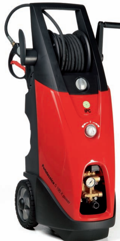
G 150x/160x POWER

[IT] Maneggevoli e facilmente trasportabili grazie al carrello, queste macchine si presentano in posizione verticale per ottimizzare, oltre alle prestazioni e ai consumi, anche lo spazio.