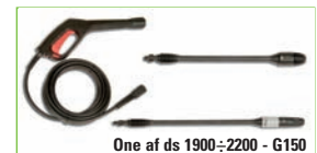
One of ds 1900-2200 - G150

[FR] Munis de: - pistolet avec rallonge athermique; - tuyau haute pression et haute température, lance avec commande commutation haute/basse pression et réglage angle du jet et buse rotative. Les versions GX et G Power sont munies en outre d'un enrouleur de tuyau.