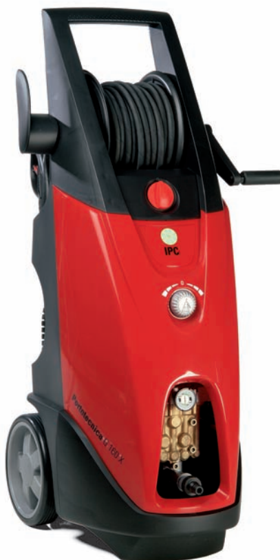
G 150x/160x OT