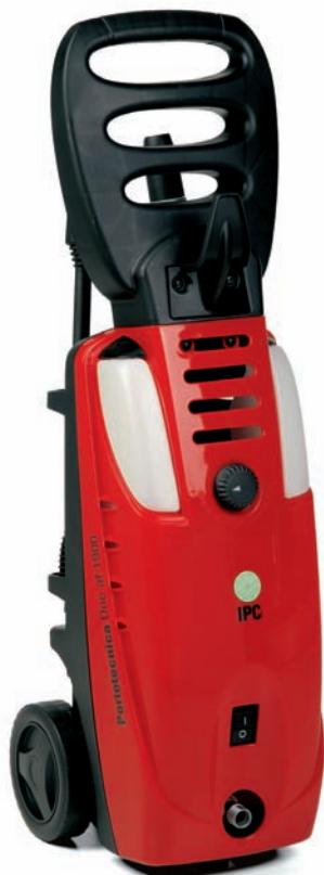
ONE AF DS 1900/2200M